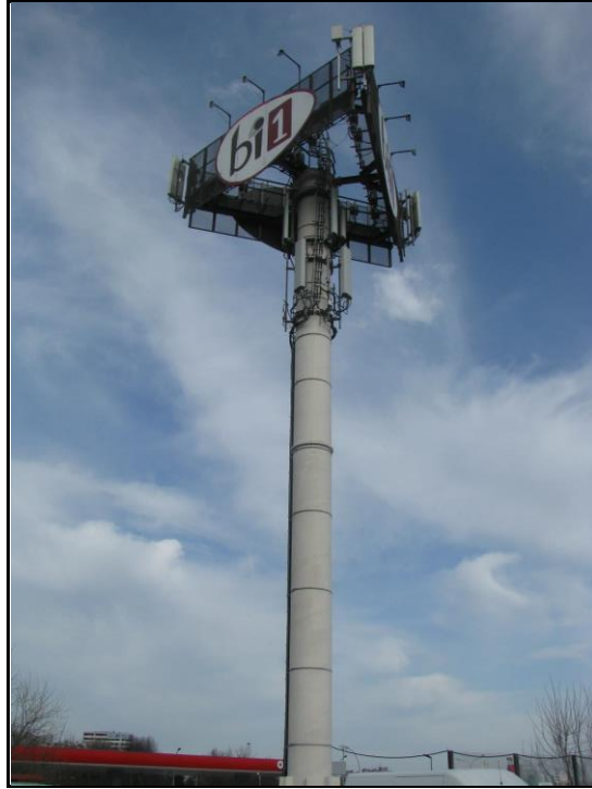
Zaf. nr 1: Widok ogólny instalacji radiokomunikacyjnej.